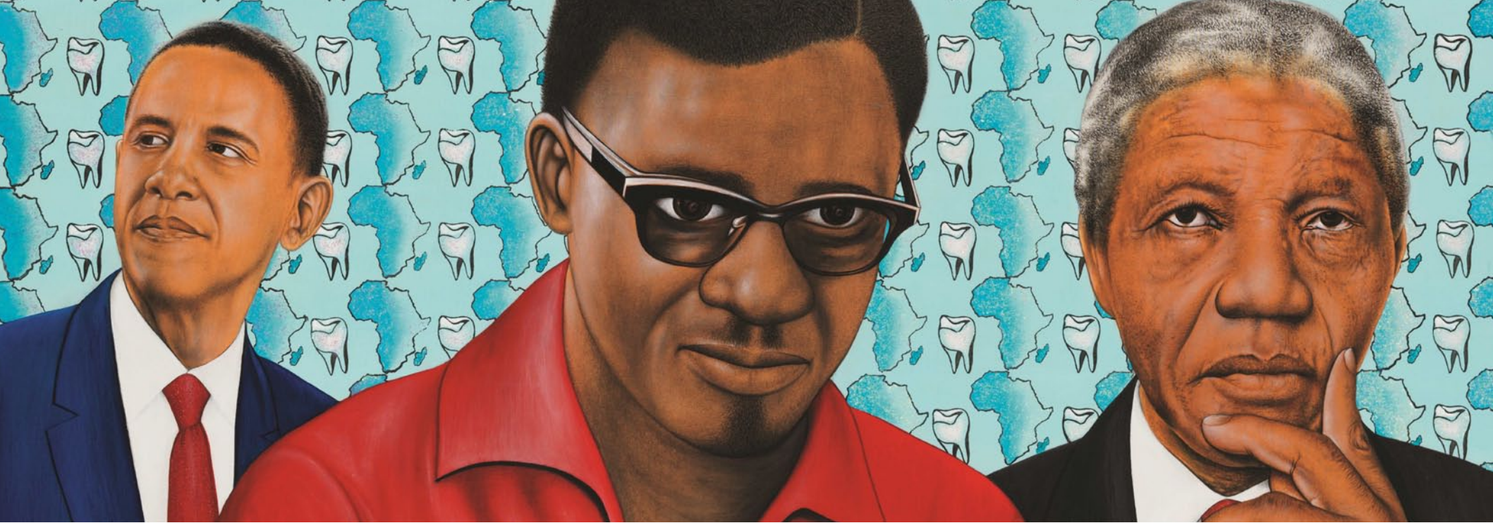
Chéri Samba, "Oui, il faut réfléchir", 2014. © Chéri Samba