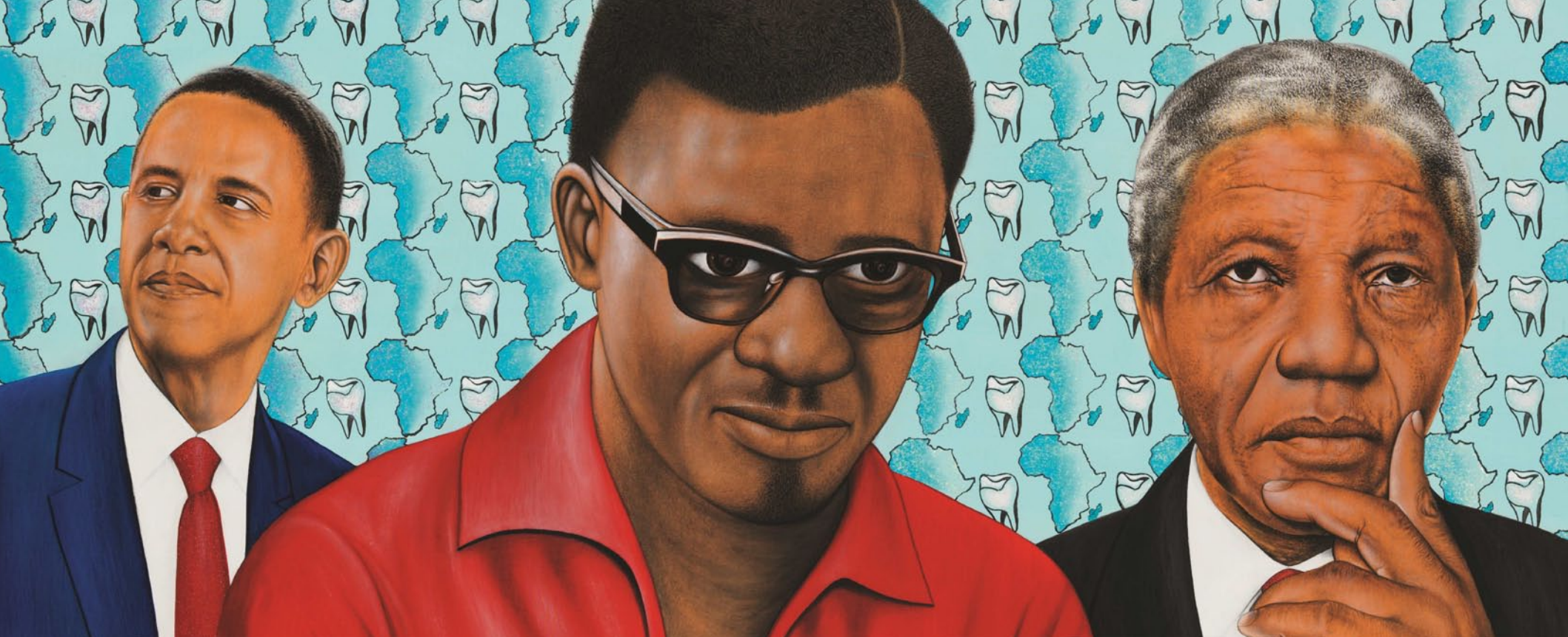
Chéri Samba, "Oui, il faut réfléchir", 2014. © Chéri Samba